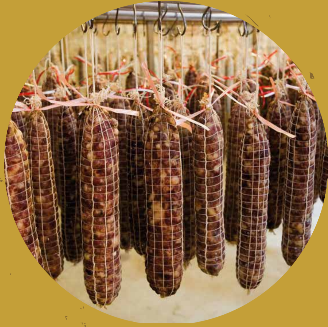
CELLA DI MONTALTO Montalto Pavese (PV)