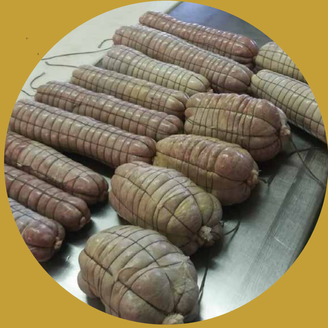
CASCINA CAREMMA Besate (MI)