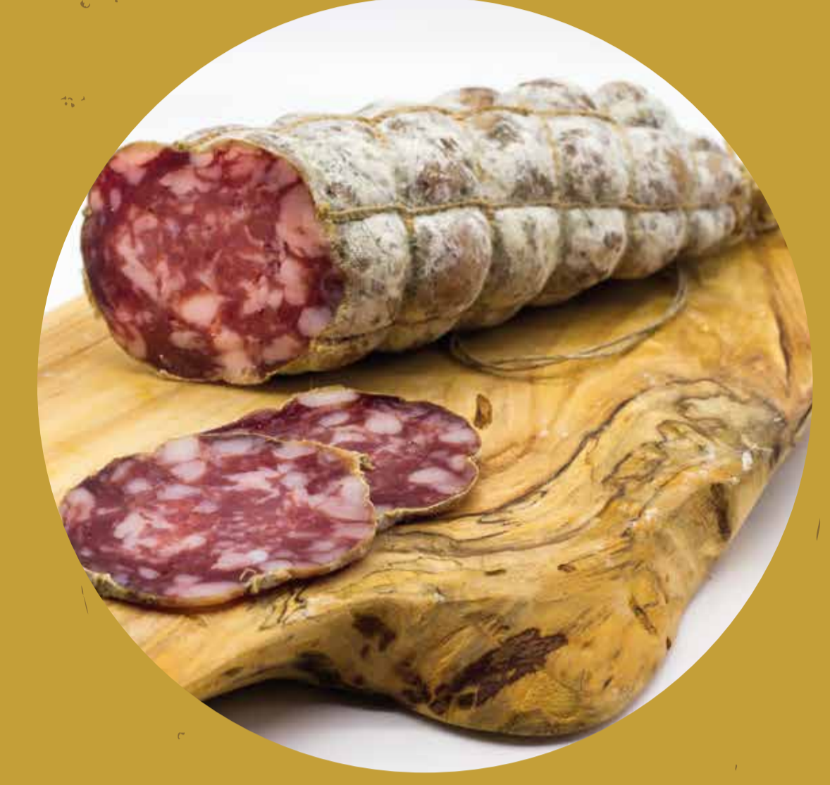
LA QUINTALINA Anzano del Parco (CO)