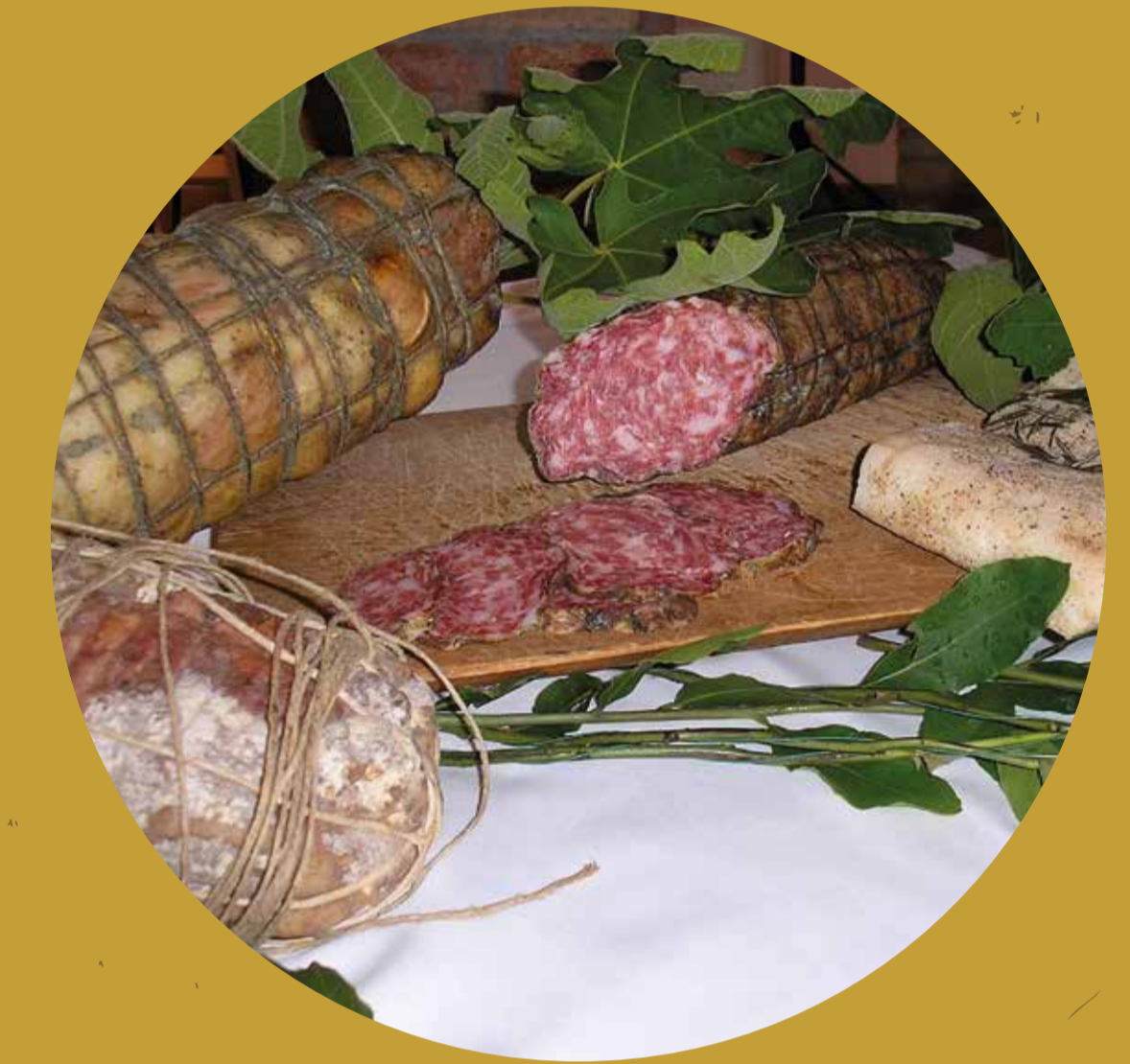
LA TORRE Ripalta Cremasca (CR)