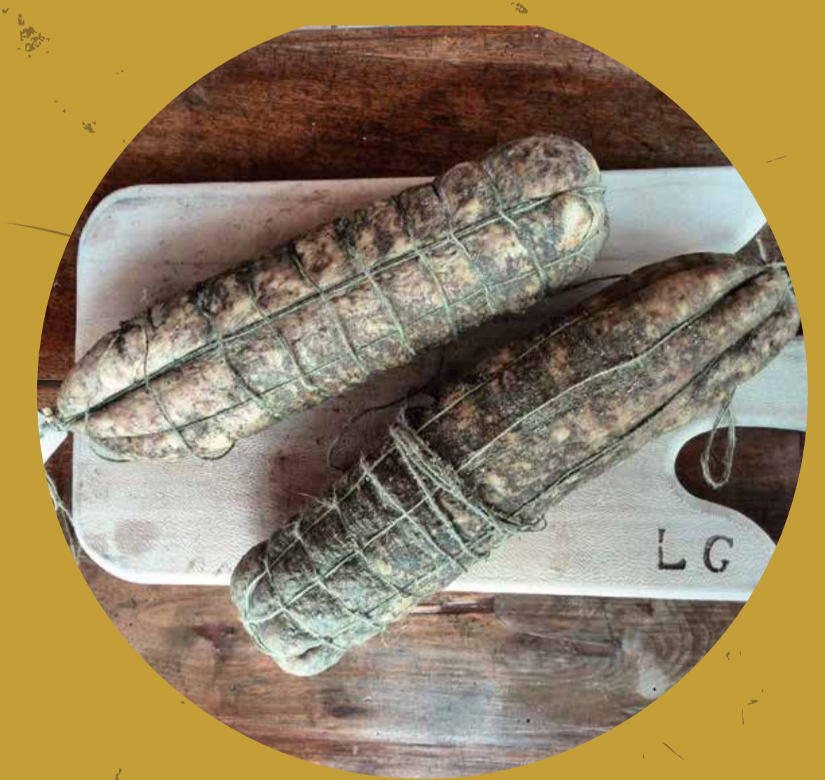
LE GARZIDE Crema (CR)