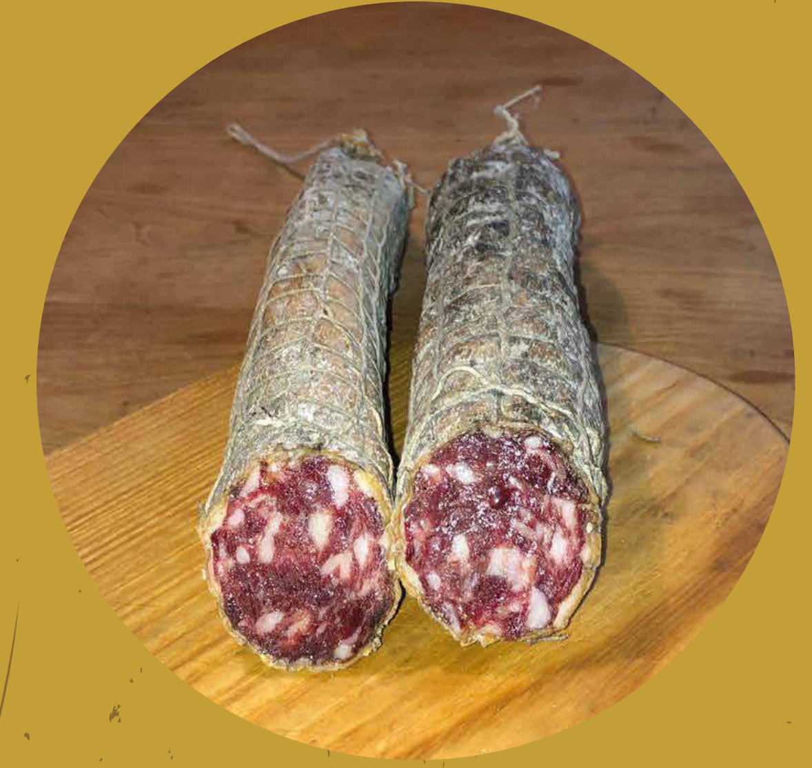
LA PECORA NERA Morbegno (SO)

FESTA DEL SALAME www.festadelsalamecremona.it