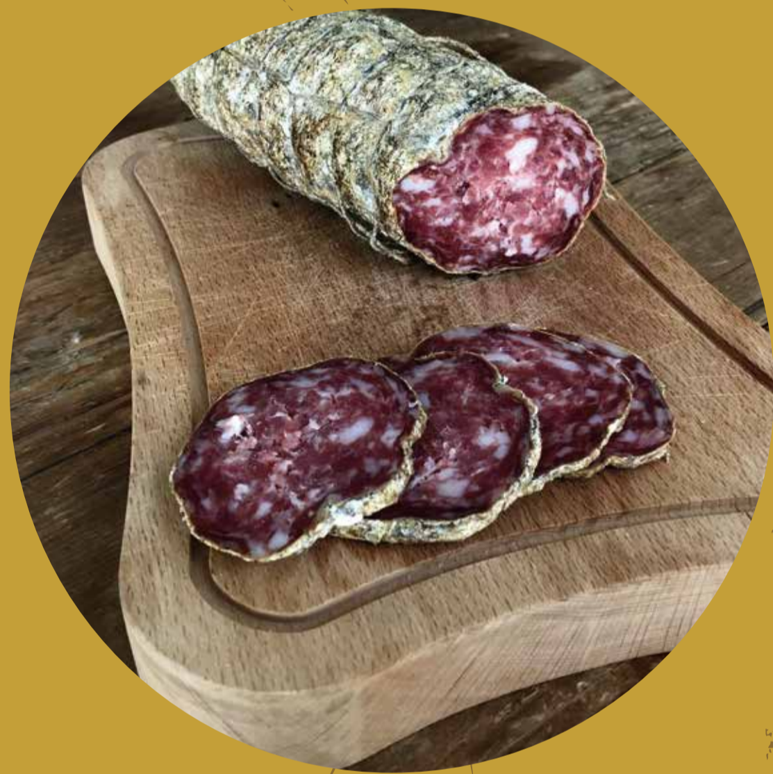
LA BALOCCHETTA Brignano Gera d'Adda (BG)