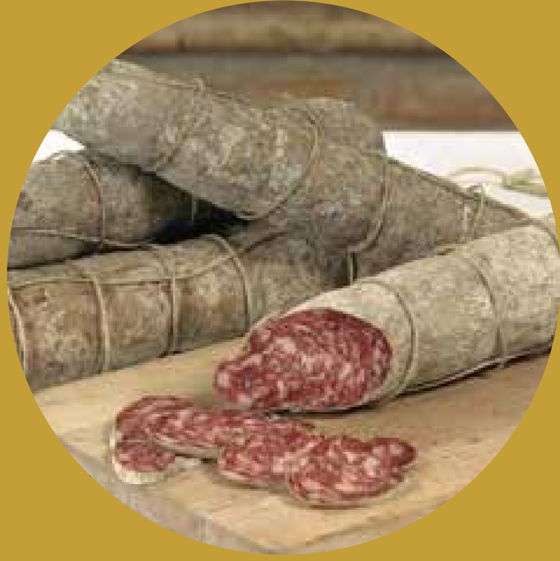
CORTE VALLE SAN MARTINO Valle San Martino (MN)