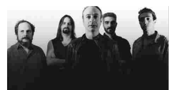
The Watch plays Genesis